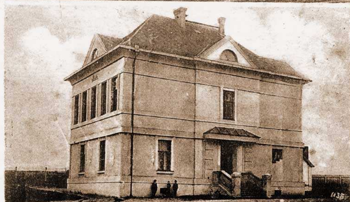
Pozdrav z ČEMÍNA.